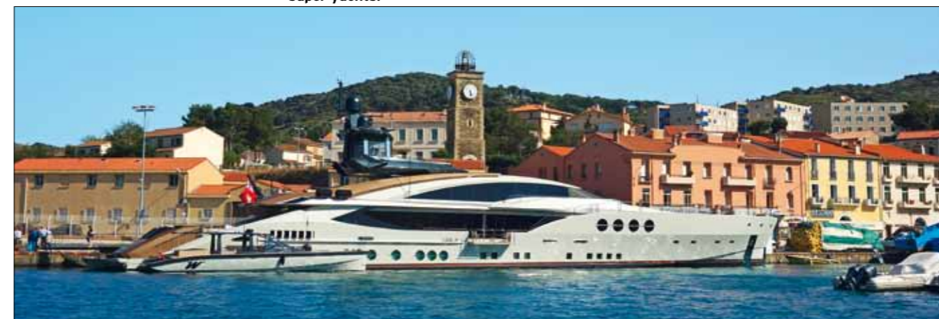
Port-Vendres est le seul port en eau profonde de la région pouvant accueillir des super yachts.