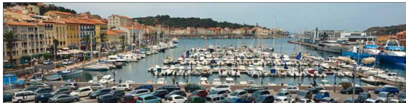
Le port de plaisance compte 250 emplacements. Les quais du port de commerce peuvent également accueillir des grands yachts de passage.