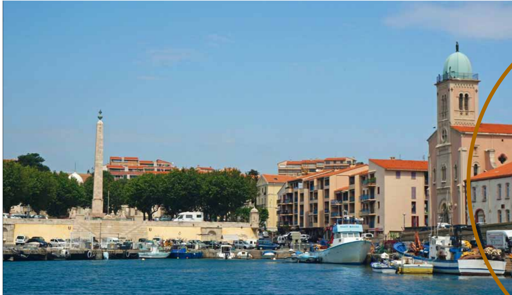
Au pied de l'obélisque érigé en l'honneur de Louis XVI, le vieux port abrite surtout des bateaux de pêche et de servitude.

En parallèle, Port-Vendres, qui est aussi une escale pour les croisiéristes (une activité en plein développement), lorgne sur les super yachts de passage. 90 yachts et super yachts y font escale en moyenne chaque année, suivant un itinéraire millénaire pour descendre ou remonter d'Espagne. Lorsque la tramontane ou le marin souffle, Port-Vendres est la seule halte possible alentour. C'est aussi le seul port en eau profonde et qui dispose de longs linéaires de quais pour des yachts jusqu'à 100 mètres. Nous apprenons également que c'est une étape «économique» intéressante pour les yachts pratiquant le charter : l'Espagne toute proche taxe à 21 % les yachts embarquant leurs passagers en Espagne, alors que la France ne demande rien. Par ailleurs, la proximité de l'aéroport de Perpignan (35 km), et une bonne desserte routière sont des atouts