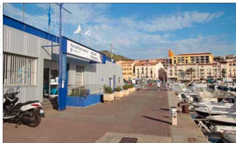
Au fond du bassin, la capitainerie est à deux pas des pontons. Elle abrite aussi le yacht-club de Port-Vendres.