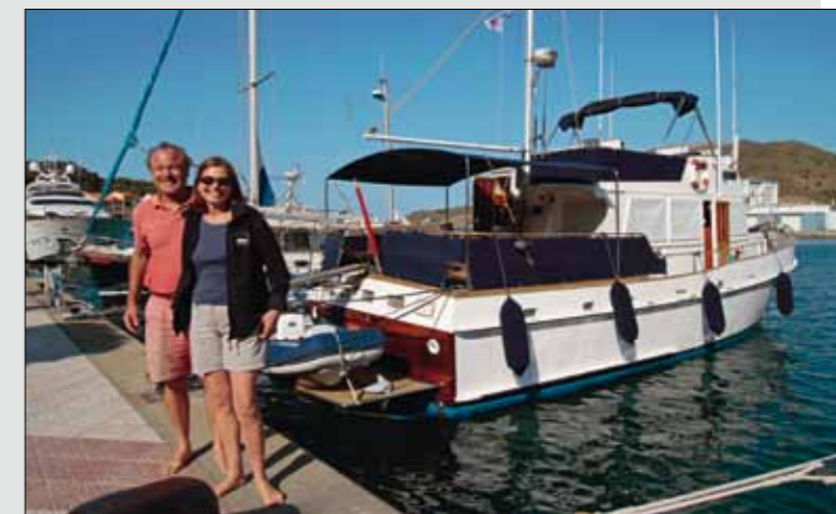
Ancetile, un Grand Banks 48 en teck de 1974, et ses heureux propriétaires entament à Port-Vendres leur troisième campagne méditerranéenne.

En tant que dernier port français de charme avant la frontière espagnole, Port-Vendres est une escale privilégiée pour les trawléristes en route pour l'aventure. C'est l'occasion pour eux de faire le plein de provision et de préparer le bateau