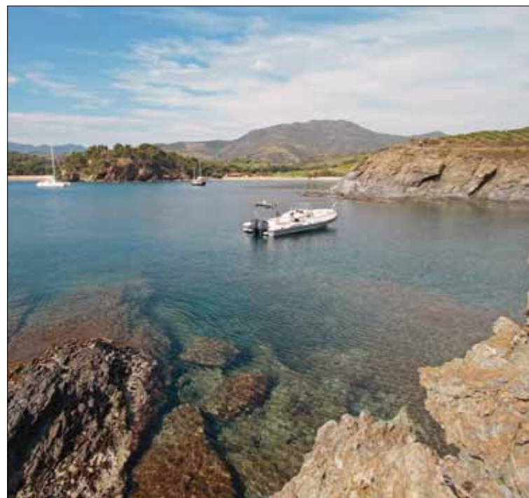
De l'autre côté du cap Bear, la baie de Paulilles est la destination préférée des plaisanciers de Port-Vendres.

► retour vers Cadaquès s'effectue dans la journée (pour les plus pressés), mais le site le plus prisé des plaisanciers locaux est la baie de Paulilles, à 2,5 milles. Entre le cap Bear et le cap Oullestrel, on y trouve trois baies bordées de plages séparées par une avancée rocheuse.