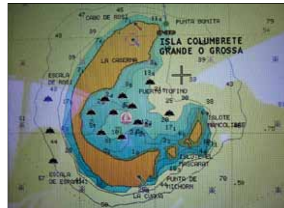
L'archipel des Columbretes est peu fréquenté par les plaisanciers français, car il est à l'écart des grandes routes maritimes touristiques. La majorité des mouillages se concentre sur l'Isla Grossa, l'île la plus spectaculaire.