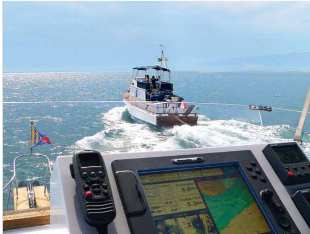
Ancetile et Prince II ont pris l'habitude de naviguer de conserve, surtout quand les conditions de mer sont optimales !

La surprise nous cueille dès 5h30 le lendemain. Nous sommes cernés par une vraie meute de chalutiers filant à toute allure sur leurs zones de pêches, spectacle saisissant dans les lueurs mauve rosé de la pointe du jour. Notre maigre flottille Grand Banks conserve avec