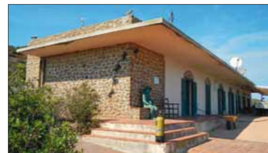
L'ancienne salle de garde est devenue un petit musée qui fait l'inventaire de la flore et de la faune de l'île.