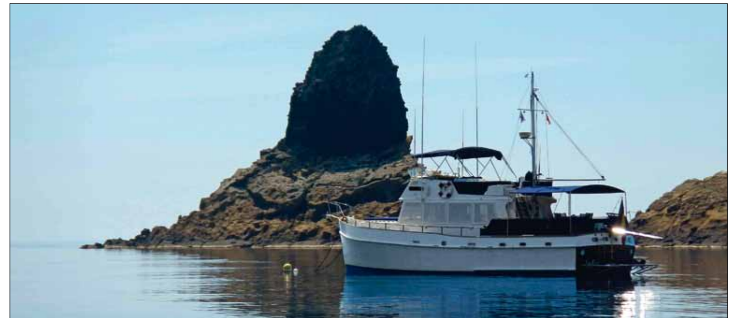
Ancetile mouillé devant l'entrée du cratère, au pied du célèbre piton rocheux baptisé le Mascarat.

boras (vipères). C'est respectueusement que nous pénétrons dans puerto Tofino, au creux de l'ellipse de l'Isla Grossa. Seul un voilier semble assoupi dans le fond du cratère ; nous avons toute la place. Sans information sur les numéros de bouées dédiées à nos longueurs, nous cherchons où nous poser en évitant les zones de rochers quasi affleurant. La «patate» n'est pas loin. L'un d'eux surnommé «trecatimones» (casse timons) surgit du fond de la mer pour raser la surface et mériter son nom. ►