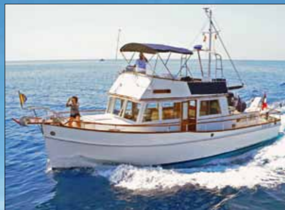
Les deux protagonistes de ce récit maritime : Ancetile, Grand Banks 48 MY de 1974, et Prince II, GB 42 Classic de 1980.

C'est à Puerto de la Selva que nous retrouvons Prince II pour entamer notre périple. Cette année, notre désir est de sortir du tracé habituel Barcelone-Majorque pour longer la péninsule plus au sud et de nous offrir un temps fort en bivouaquant dans le cratère du volcan sous-marin des Iles Columbretes, à 30 milles marins à l'est du cap d'Oropesa. Bien sûr la météo doit être obligatoirement de la partie, ce qui n'est pas gagné vu