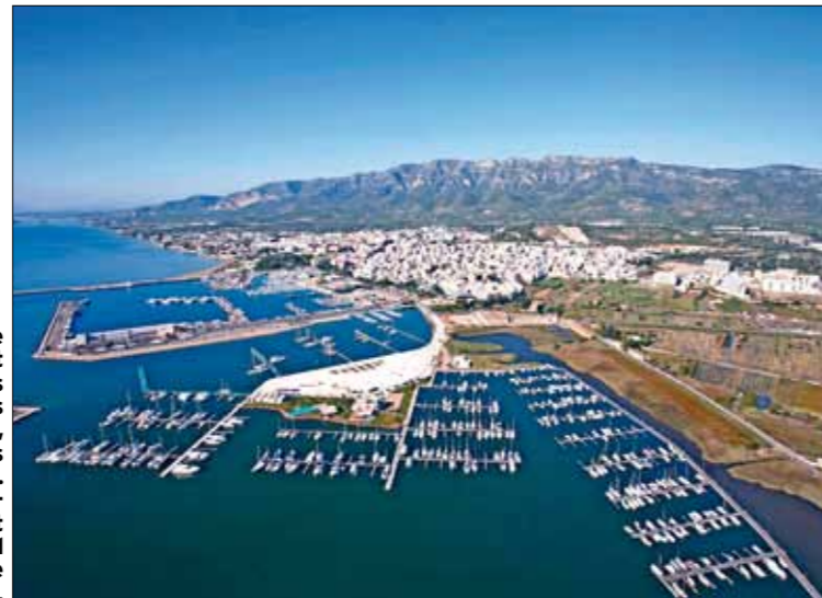
Le port de La Rapita est l'un des plus proches des Columbretes, 40 milles au sud-est. Sa marina ultramoderne est située au fond d'une lagune bien protégée.