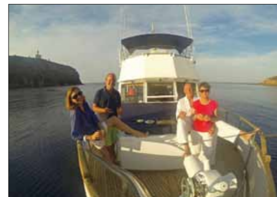
Coucher de soleil sur le GB 48 à l'heure de l'apéro. Curieux de se dire qu'il y a 80 m de fond sous la quille !

En toute impunité, ces voyous volants n'hésitent pas à s'inviter chez les gardes et lancer des attaques en piqué sur les poubelles de la cuisine. Le panorama est époustoufflant et prend toute sa dimension sur le belvédère du phare. L'ellipse d'un kilomètre de l'île présente au sud un monument à la Vierge et un minuscule cimetière, reliés par un chemin qui longe l'épine ►